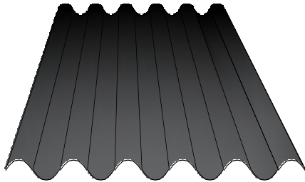
LÁMINA ACANALADA NORMA: ASTM A – 653 NORMA: ASTM A – 792, galvanizada